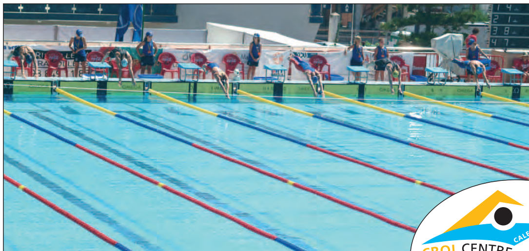
■ Moment de sortida d'una de les moltes competicions realitzades durant el campionat.

Tant la Reial Federació Espanyola de Natació com els mitjans de comunicació no han dubtat en qualificar l'organització d'aquest esdeveniment esportiu de perfecte i acurada, així com també no han dubtat en ressaltar les magnífiques instal·lacions de Crol Centre Calella , cedides en aquesta ocasió pel Club Natació Calella a la Federació de l'Estat. La ubicació d'espais amb graderia tant per al públic, com per la premsa, una zona de vips per al Comitè de Competició o per als mateixos participants ha estat encertada i amb la senyalització deguda. Annexa al complex esportiu, s'hi va instal·lar un village que permetia als organitzadors i participants passar l'estona amb comoditat tot envoltats de serveis de tota mena, i estants de materials i productes a l'entorn de la natació. En aquest sentit, cal reconèixer l'esforç dels membres del Comitè Organitzador i Executiu d'aquesta competició del