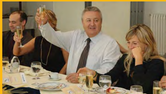
Un brindis per un futur turístic millor.