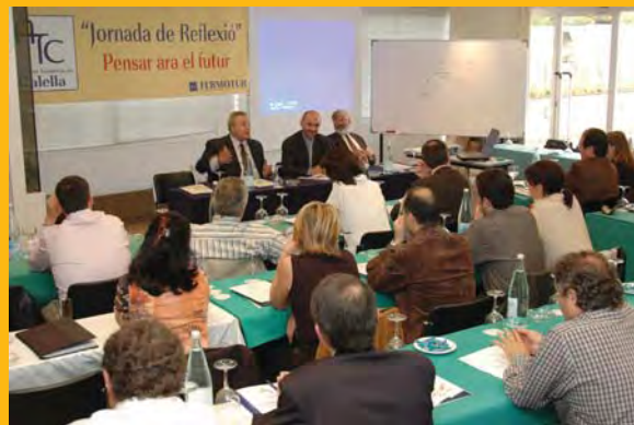
Detall gràfic d'una de les sessions.