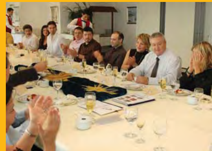
Recull gràfic de l'àpat de germanor.