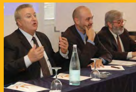
El Sr. Tur va exposar el seu punt de vista.