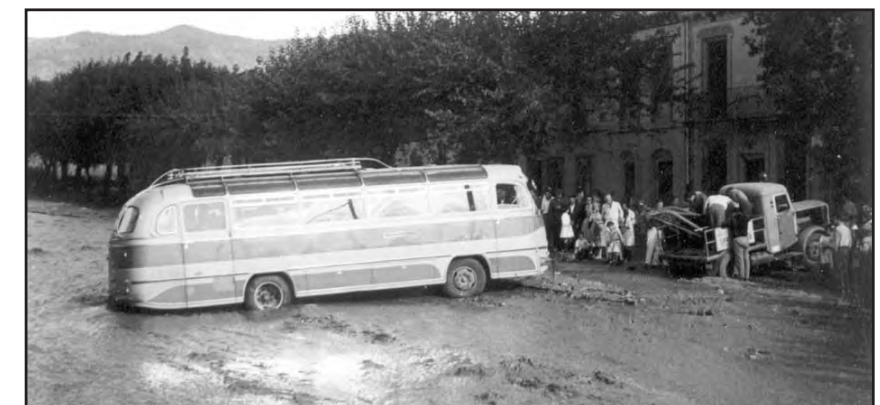
★ Una de les 750 imatges que apareixen en el llibre.