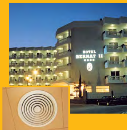
T. Hotel BERNAT II **** (Calella) Climatització