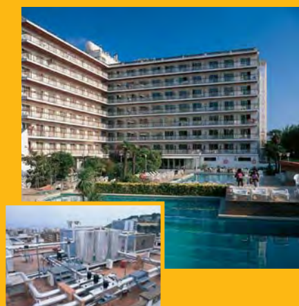
T. Hotel PRESIDENT *** (Calella) Climatització