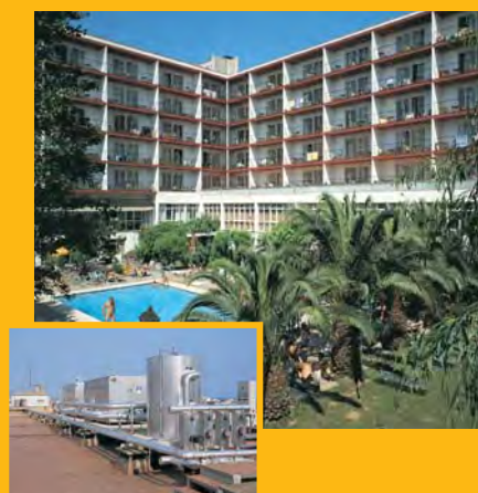
T. Hotel SANTA FE *** (Calella) Climatització

Ens esperona estar al servei dels millors