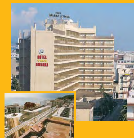
T. Hotel TOP AMAIKA **** (Calella) Climatització