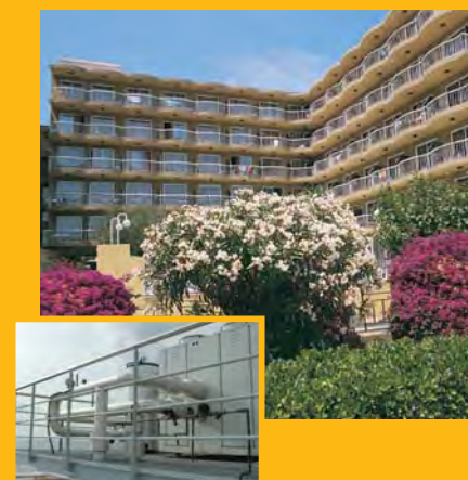
T. Hotel VOLGA *** (Calella) Climatització