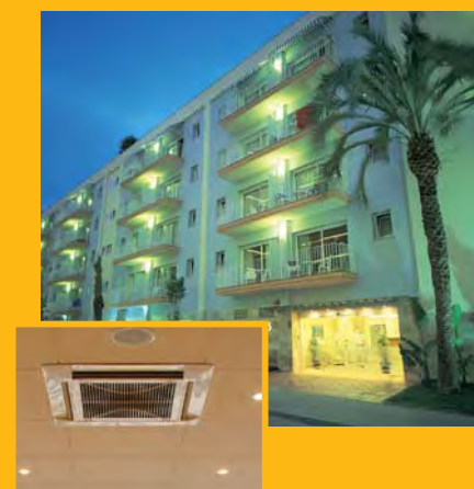
T. Hotel LES PALMERES **** (Calella) Climatització