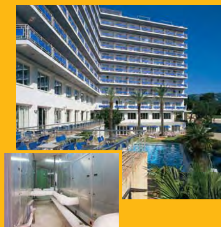
T. Hotel SERHS OASIS PARK *** (Calella) Climatització