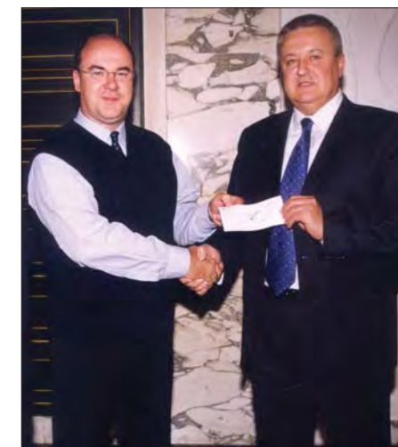
★ Acte de lliurament de la col·laboració econòmica de Termotur.

A mb motiu de la celebració del 50è aniversari de l'arribada del turisme vacacional a Calella, TERMOTUR va tenir interès en col·laborar amb la comissió organitzadora, aportant un total de 12.000 €, amb el prec de que anessin destinats a l'edició d'un llibre commemoratiu. Aquesta iniciativa va quallar i amb satisfacció aviat veurà la llum un volum que permetrà copsar la realitat d'aquest dilatat període (1953-2003). La seva presentació està prevista pels volts de Nadal.