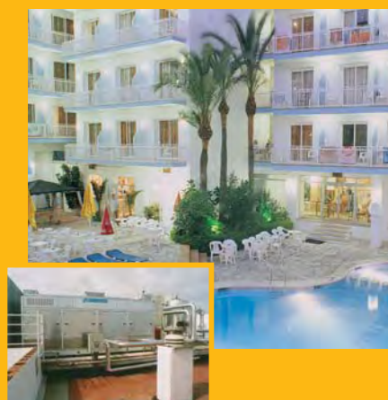
T. Hotel MIAMI *** (Calella) Climatització