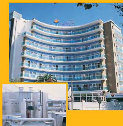
T. Hotel MARÍTIM *** (Calella) Climatització