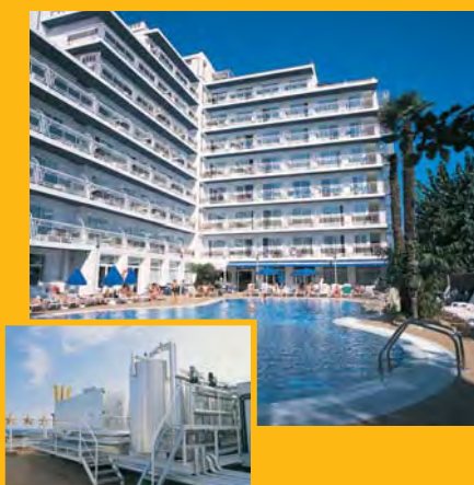
T. Hotel MAR BLAU *** (Calella) Climatització